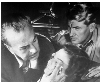
1953 LE GUÉRISSEUR d'Yves Ciampi avec Danièle Delorme, Jean Marais