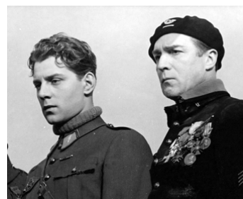
1935 L'ÉQUIPAGE d'Anatole Litvak avec Jean-Pierre Aumont