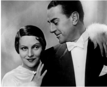
1938 NUITS DE PRINCE de Vladimir Strijewski avec Kathe de Nagy