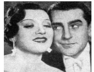
1933 TOI QUE J'ADORE de Geza von Bolvary & Albert Valentin avec Edwige Feuillère