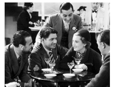
1936 ANNE-MARIE de Raymond Bernard avec Paul Azaïs, Annabella