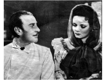
1939 LE PÈRE LEBONNARD de Jean de Limur avec Madeleine Sologne