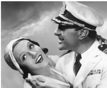
1931 LE CAPITAINE CRADDOCK d'H. Schwarz & M. de Vaucorbeil avec Kathe de Nagy