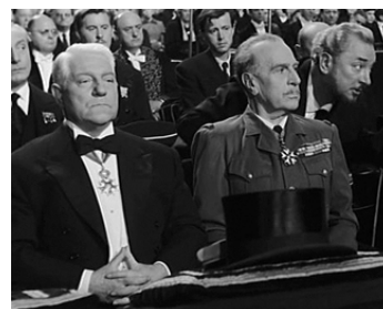
1958 LES GRANDES FAMILLES de Denys de La Patellière avec Jean Gabin, Pierre Brasseur