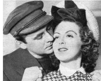
1942 LA FEMME PERDUE de Jean Choux avec Renée Saint-Cyr