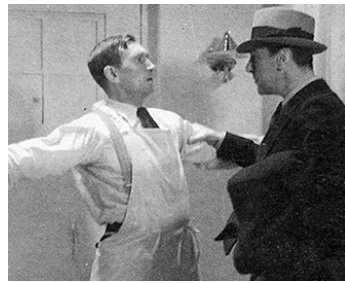
1936 L'HOMME À ABATTRE de Léon Mathot avec Raymond Aimos