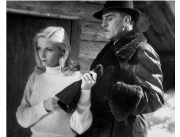
1943 L'ÉTERNEL RETOUR de Jean Delannoy avec Madeleine Sologne