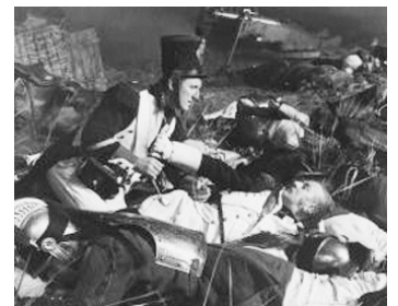
1957 LES MISÉRABLES de Jean-Paul Le Chanois avec Bourvil