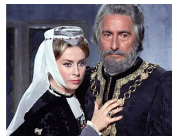
1963 LE PONT DES SOUPIRS de Piero Pierotti & Carlo Campogalliani avec Vira Silenti