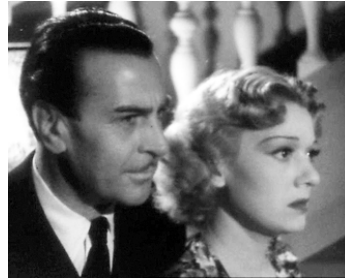
1938 J'ÉTAIS UNE AVENTURIÈRE de Raymond Bernard avec Edwige Feuillère