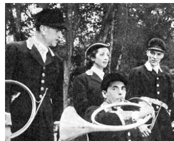
1955 L'AMANT DE LADY CHATTERLEY de Marc Allégret avec Danielle Darrieux