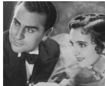
1932 L'HOMME À L'HISPANO de Jean Epstein avec Marie Bell