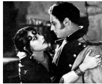
1926 CARMEN de Jacques Feyder avec Raquel Meller