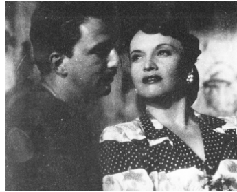
1946 CHEMINS SANS LOI de Gaston Radot avec Ginette Leclerc