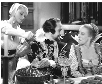
1935 LA KERMESE HÉROÏQUE de Jacques Feyder avec Françoise Rosay