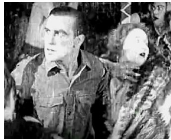
1924 LA GALERIE DES MONSTRES de Marcel L'Herbier & Jaque-Catelain avec Claire Prella