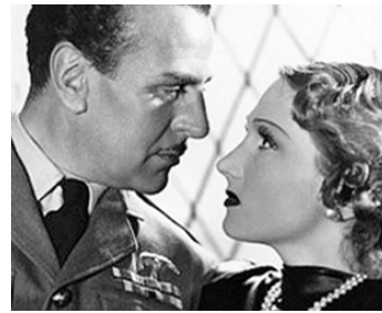
1937 TROÏKA SUR LA PISTE BLANCHE de Jean Dréville avec Jany Holt