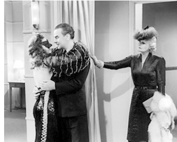
1942 MADEMOISELLE SWING de Richard Pottier avec Irène de Trébert, Elvire Popesco