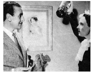
1937 ALOHA, LE CHANT DES ÎLES de Léon Mathot avec Arletty