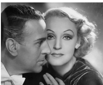
1934 LE SECRET DES WORONZEFF d'Arthur Robison & André Beucler avec Brigitte Helm