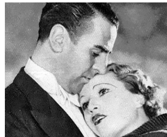
1933 MADEMOISELLE JOSETTE, MA FEMME d'André Berthomieu avec Annabella