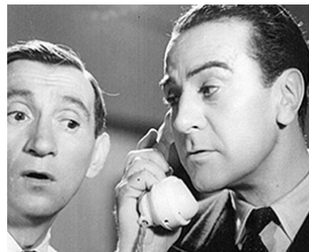
1933 UN CERTAIN MONSIEUR GRANT de Gerhard Lamprecht & R. Le Bon avec Raymond Aimos