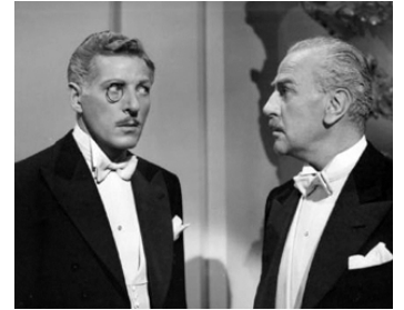
1951 SUR LA RIVIERA (On the Riviera) de Walter Lang avec Danny Kaye